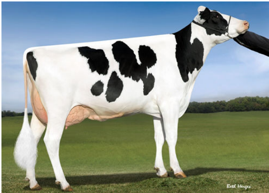
OCD SUPERSIRE 9882 GRANDDAM